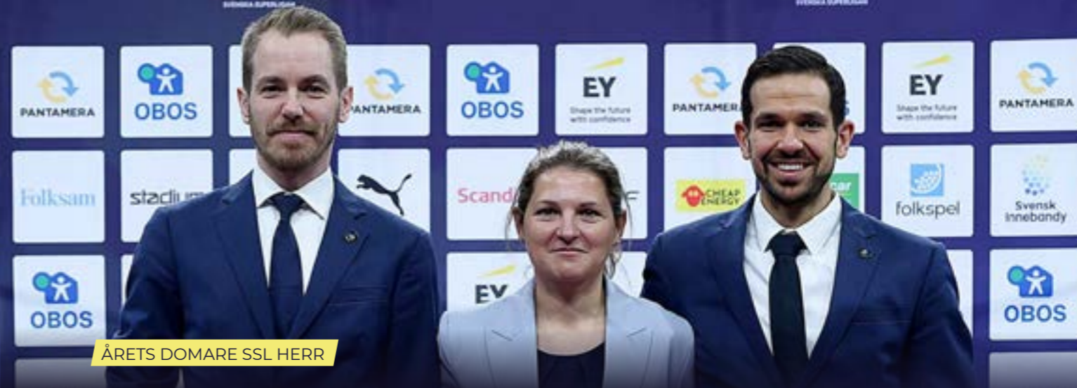
ÅRETS DOMARE SSL HERR

– Det här är otroligt roligt och ärofyllt. Men det är också något vi gör tillsammans med våra kollegor hela året. Vi hjälper varandra att bli bättre. Vi är ett gäng som gör resan tillsammans, även om vi tävlar mot varandra. Det är det som gör att vi kan stå här idag.