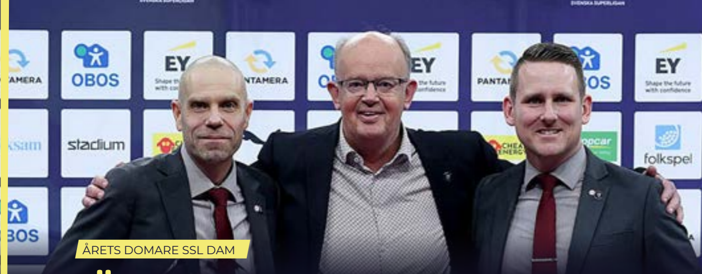
ÅRETS DOMARE SSL DAM