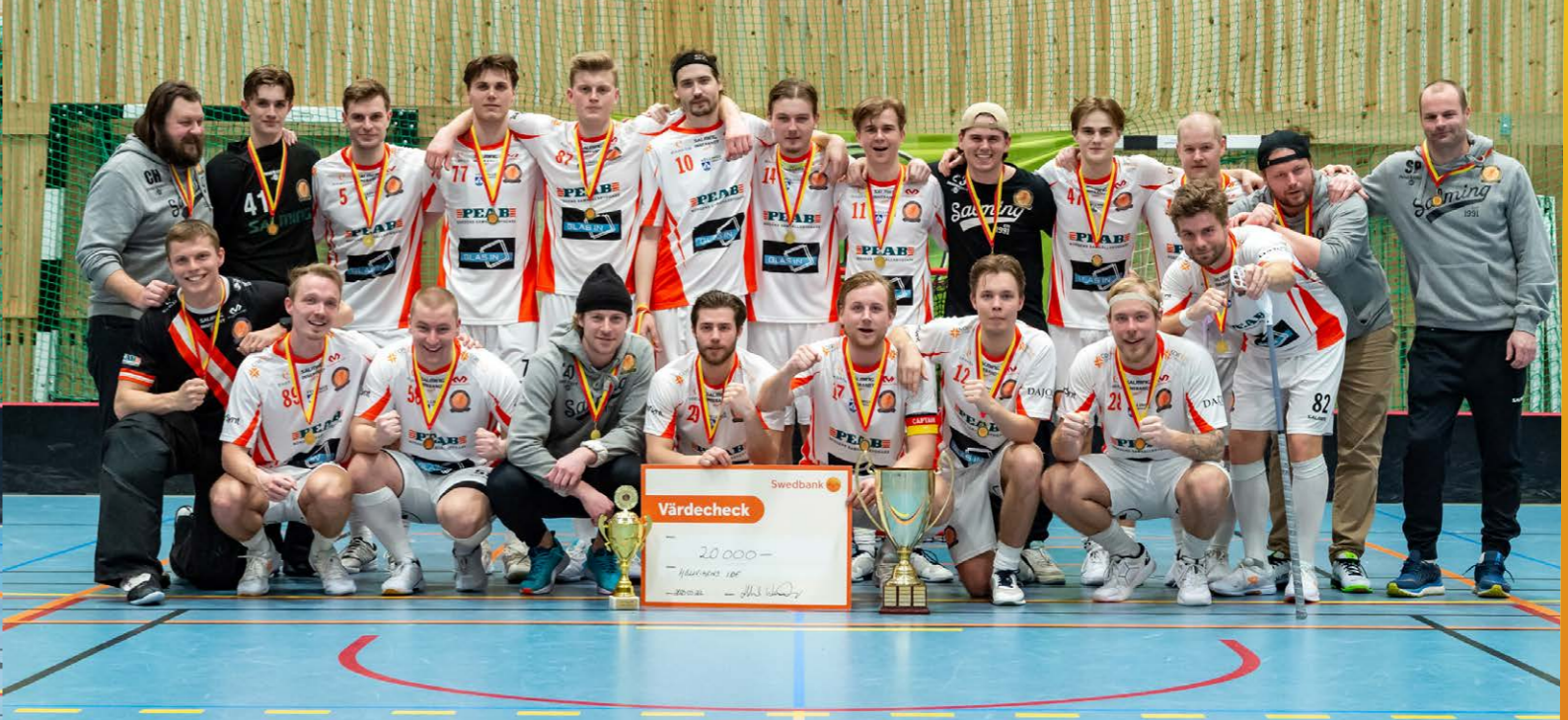
Höllvikens IBF tog hem segern i Skånemästerskapen herr säsongen 22/23.