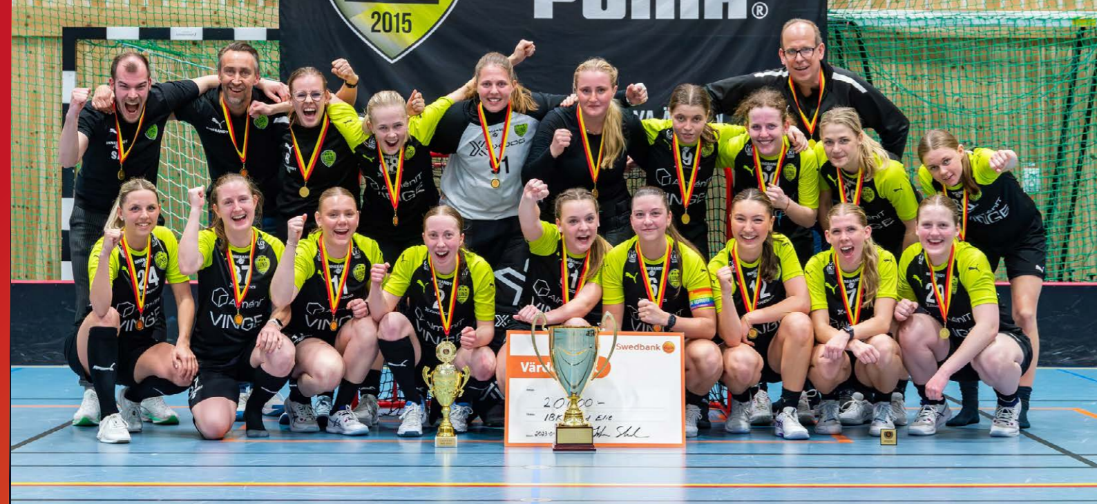
IBK Lund tog hem segern i Skånemästerskapen dam säsongen 22/23.