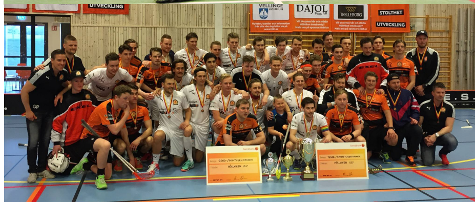
Höllvikens IBF - Skånemästare på herrsidan säsongen 2016/17