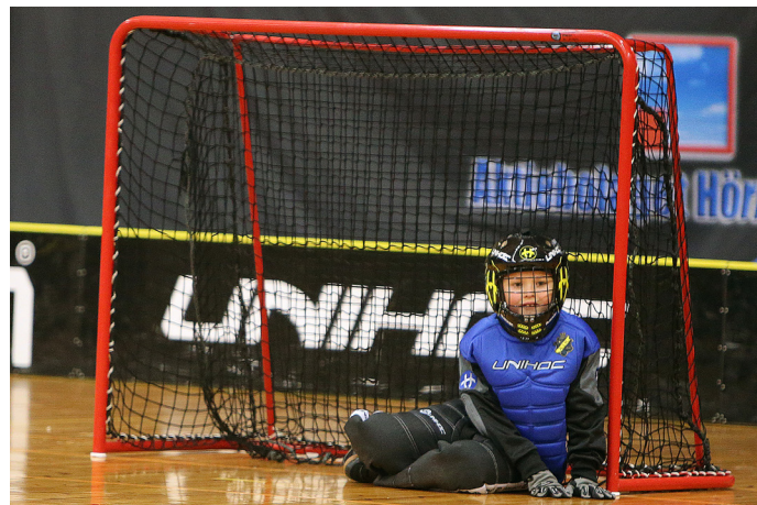
I de gamla fullstora innebandymålen har våra allra yngsta målvakter nästan ingen som helst chans att rädda skotten.

I enlighet med svensk innebandys beslut på Tävlingskongressen 2014 har 15-åringar (födda 2001), med vissa undantag, inte fått delta i seniorspel